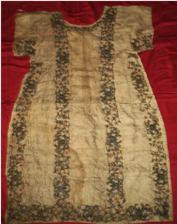
Εικ. 1. Το ένδυμα του Πελοποννησιακού Λαογραφικού Ιδρύματος.

Το κεντημένο τμήμα ενδύματος, το οποίο θα μας απασχολήσει, αποκτήθηκε από το Πελοποννησιακό Λαογραφικό Ίδρυμα τα τελευταία χρόνια και φέρει αριθ. εισ. 2006.06.0553. Είναι εξαιρετικά αξιόλογο, δεν είναι όμως εξ υπαρχής σαφές για τι ακριβώς ένδυμα πρόκειται και ποιος ο προορισμός του. Θα προσπαθήσουμε να αποσπάσουμε τις πληροφορίες που ενσωματώνει το ίδιο το αντικείμενο για να επιλύσουμε κατά το δυνατόν αυτά τα προβλήματα (εικ. 1). Οι διαστάσεις του φορέματος και προπαντός η αναλογία του μήκους του μπούστου ως προς το συνολικό μήκος δεν αντιστοιχούν σε ένδυμα νεαρού κοριτσιού, πιο εύκολα παραπέμπουν σε ένα μακρύ βαπτιστικό. Στον 19ο όμως αιώνα το βαπτιστικό είναι πάντα λευκό και κατασκευάζεται από λεπτό λινό ύφασμα με ασπροκεντήματα και δαντέλες. Στις προγενέστερες εποχές, όπου υπάρχουν παιδικά φορέματα με χρυσοκε-