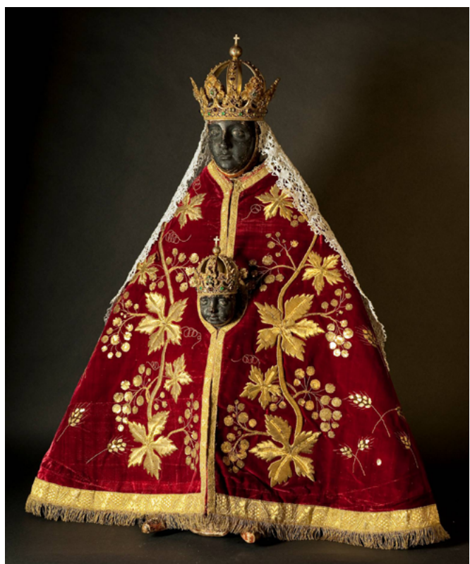
Εικ. 3. Η Μαύρη Παρθένος του Puy-en-Velay.

Η μόνη περίπτωση που μπορεί να είναι χρηστικό ένα μπροστινό μέρος ενδύματος είναι ως ένδυμα εκκλησιαστικού αγάλματος. Στην Καθολική Εκκλησία υπάρχει η παράδοση, η οποία εξακολουθεί μέχρι τις μέρες μας, να ντύνονται τα αγάλματα των αγίων, κυρίως της Παναγίας και του μικρού Χριστού. Στην εικ. 3 απεικονίζεται το άγαλμα της Μαύρης Παρθένου από το Puy-en-Velay στη Γαλλία. Το 2005, στη μεγάλη γιορτή του Ιωβιλαίου, που γίνεται όταν η Μεγάλη Παρασκευή συμπίπτει με την εορτή του Ευαγγελισμού –γεγονός που συμβαίνει δύο με τρεις μόνο φορές μέσα σε έναν αιώνα– της προσέφεραν έξι μαντό και δαντελένια πέπλα. Η εικ. 4 απεικονίζει τον μικρό Χριστό της Πράγας. Οι διαστάσεις του ενδύματος του Πελοποννησιακού Λαογραφικού Ιδρύματος αντι-