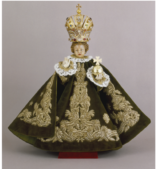
Εικ. 4. Ο μικρός Χριστός της Πράγας (Εκκλησία της Παρθένου Νικήτριας). Αρχείο της Μονής του Μικρού Χριστού, φωτ. Petr Hron.

Τα περισσότερα μοτίβα δημιουργούνται και από τα δύο υλικά μαζί. Τα μεταξωτά λουλούδια έχουν το κέντρο από χρυσονήμα, ενώ τα υπόλοιπα φυτικά μοτίβα αναμειγνύουν χρυσονή-