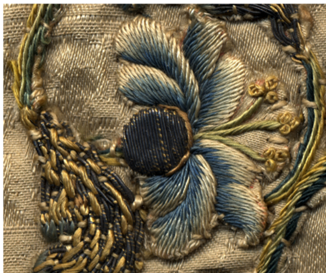
Εικ. 6. Λεπτομέρεια μεταξωτού άνθους.

ματα, των οποίων οι κλωστές στερέωσης παραμένουν στην επιφάνεια, συμβάλλοντας έτσι στη χρωματική έμφαση του μοτίβου με διαφόρων χρωμάτων μεταξωτές κλωστές. Το χαρακτηριστικό αποτέλεσμα που δημιουργείται θα μπορούσε να έχει ενισχυθεί τη στιγμή της μεταφοράς του κεντήματος στο ύφασμα, με τη χρήση επιπλέον χρωματιστών μεταξωτών κλωστών προς ενίσχυση των παρυφών των μοτίβων. Τα χρυσονήματα δουλεύονται με διάφορους τρόπους: άλλοτε στερεώνονται ανά τρία και άλλοτε στρίβονται ανά δύο κλώνους μαζί (εικ. 6).