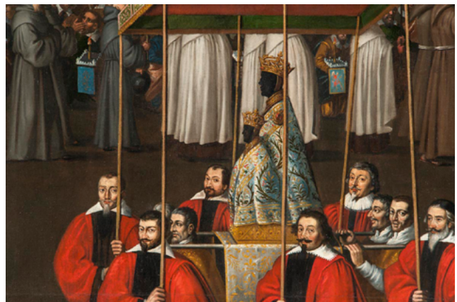
Εικ. 5. Λεπτομέρεια από τον πίνακα «Voeu de la Peste» του Jean Solvain.