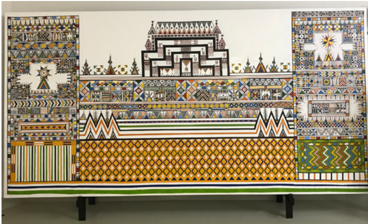
Εικ. 2. (α) Ζωγραφικός πίνακας από το Χιτζάζ με γεωμετρικά σχέδια που προσομοιάζουν με αυτά της Υεμένης (περίπου 1987). Μουσείο του Ithra. (β) Λεπτομέρεια από κεντημένο με μάλλινα νήματα ανδρικό εξωτερικό ένδυμα της περιοχής με τα ίδια μοτίβα (περίπου 1940).